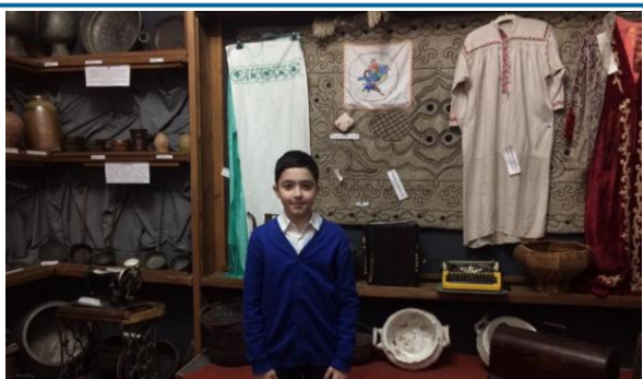
Хасавюртовский историко-краеведческий музей