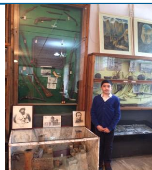
Хасавюртовский историко-краеведческий музей