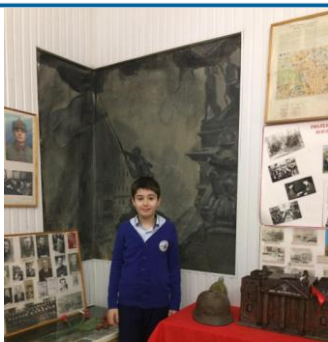
Хасавюртовский историко-краеведческий музей