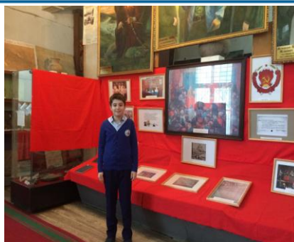
Хасавюртовский историко-краеведческий музей