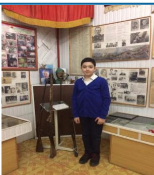
Хасавюртовский историко-краеведческий музей