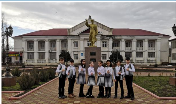
Городская площадь им. З.Н.Батырмурзаева

5. Сделай фоторепортаж на одну из тем: «Площадь современного города (села)», «Фонари на улицах города (села)», «Музыка на городских и сельских праздниках». А может быть, ты сам (-а) придумаешь тему?